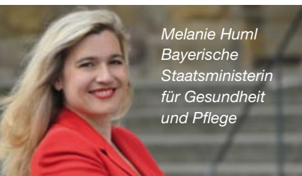
Melanie Huml Bayerische Staatsministerin für Gesundheit und Pflege